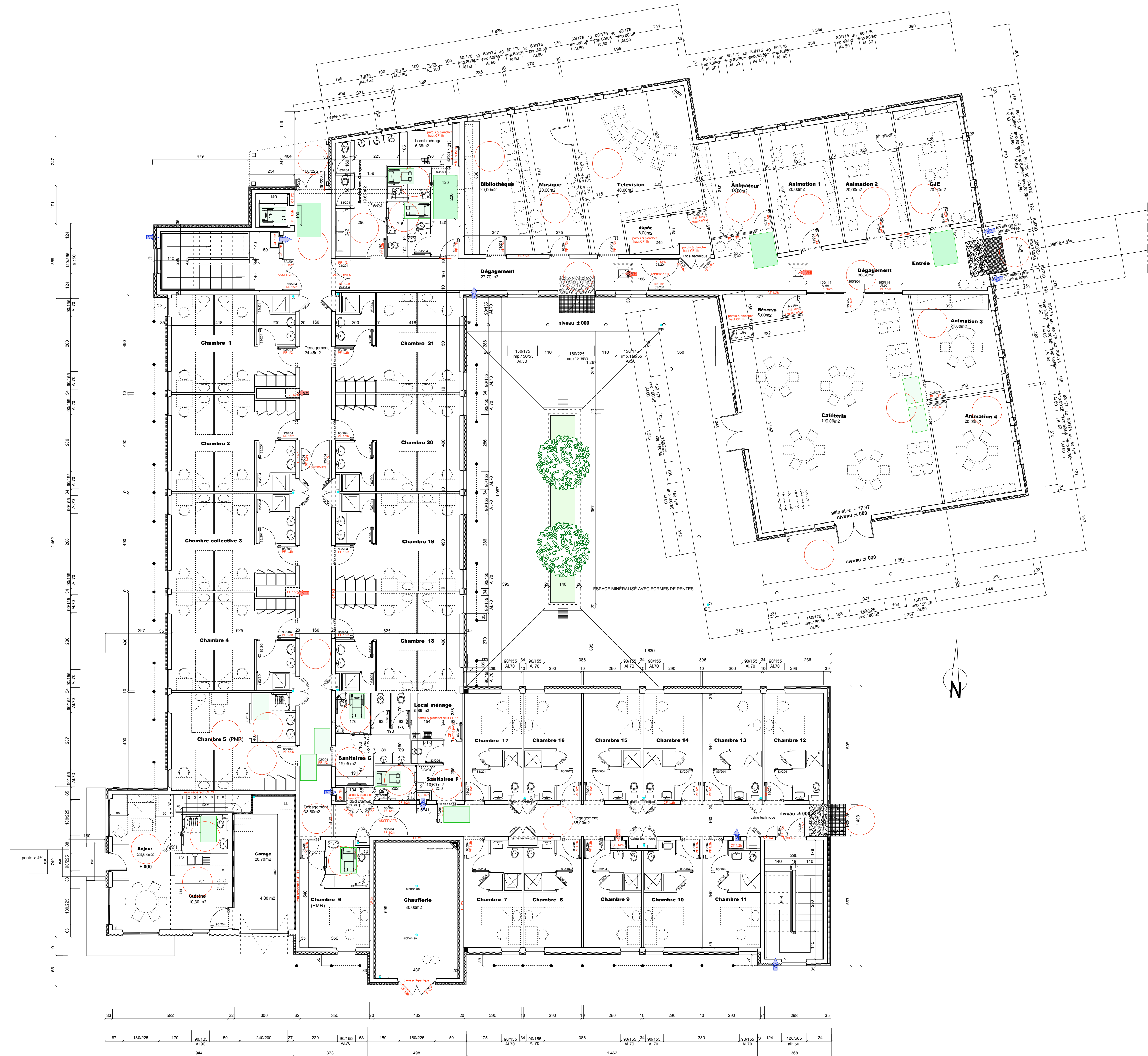
REZ DE CHAUSSEE